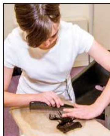
Pokládané vlny se žáci učí na vlasových dílkách připevněných na vlásenkářských polštářích

Pokládaná vlna je klasický způsob tvarování vlasů, ale řada adeptů kadeřnického umění ji považuje spíše za noční múru. Provází je totiž během celých tří let studia a každý půlrok z ní dělají zkoušku. Většina z nich je přitom přesvědčena, že ji v praxi vůbec nevyužije. Současné módní trendy jsou však důkazem, že klasika nikdy úplně nevyjde z módy. A i kdyby vlny za pár let přestaly být aktuální, klientky, které rády protančí celou plesovou sezonu, a hlavně nevěsty je ocení vždycky. „Pokládaná vlna, respektive vlna jako taková je podle mne základem kadeřnické profese, proto z osnov středního odborného školství určitě nikdy nezmizí,“ říká Mgr. JAN CIGÁNIK, ředitel SOU kadeřnického v Praze 8. „Vychází z ní totiž řada dalších technik, které se žáci učí už od prvního ročníku – po pokládané vlně následuje kroužkování, vodová, foukaná a jejich využití v konkrétních účesových stylech atd. Naším úkolem je naučit budoucí kadeřníky všechny základní dovednosti, aby dokázali reagovat na módní trendy a vytvářet klientům slušivé účesy.“